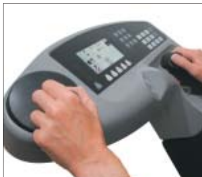
Plancia dei comandi