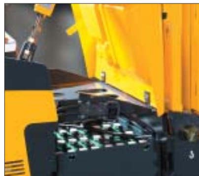
Coperchio batteria ribaltabile