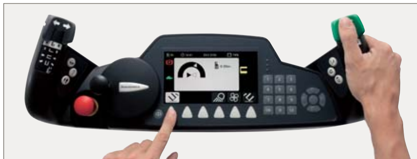
Salita a bordo