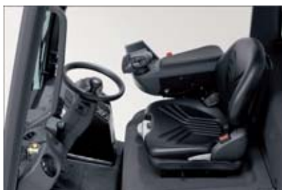
Posto di lavoro ergonomico